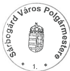
dr. Sükösd Tamás polgármester